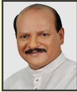
ගරු ප්‍රධාන අමාත්‍ය සරත් ඒකනායක මැතිතුමා